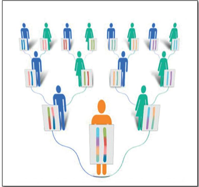
Y-kromosomi periytyy aina isältä pojalle.

Oheinen kuva: Johdatus geneettiseen sukututkimukseen. Suomen Sukututkimusseura, Helsinki 2017