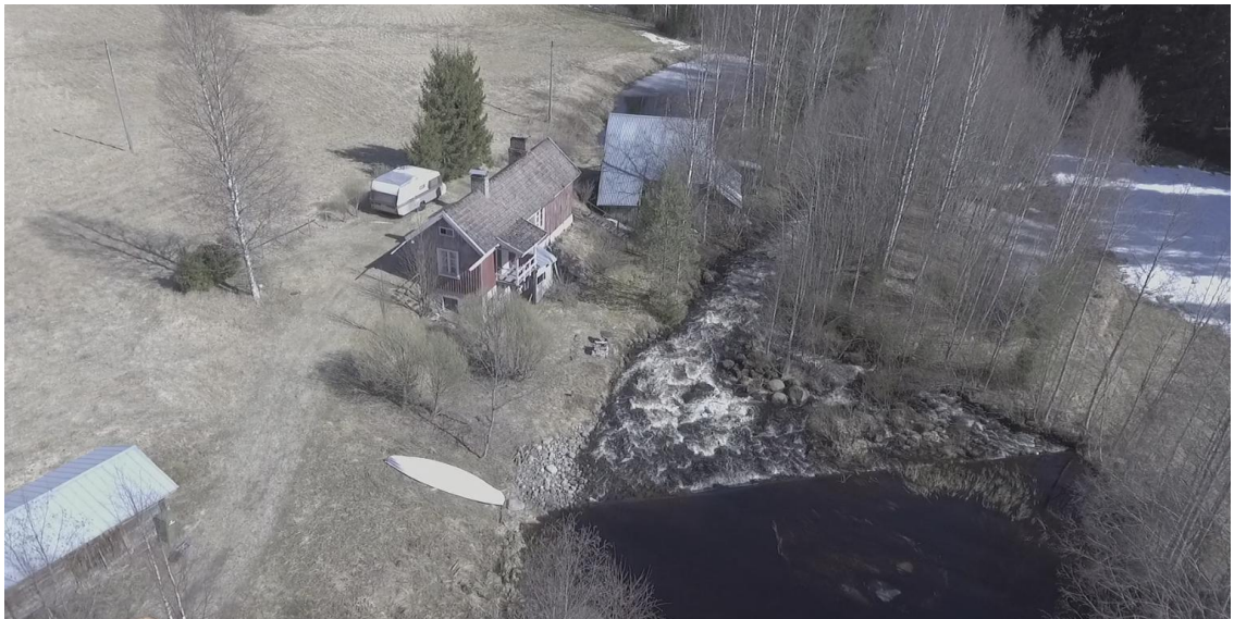
Ilmakuva Konttimyllystä ,myllärin talo ja myllyrakennus yllimpänä. 4.5.2017

Vuonna 1998 myllyn pato purettiin ja tilalle rakennettiin ns. pohjapato, joka säätelee automaattisesti veden korkeuden joessa.