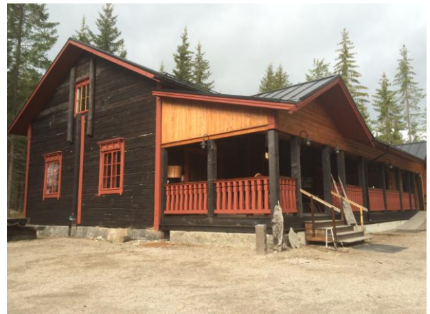
Kokoontumispaikkamme Perinnetupa ulkoa