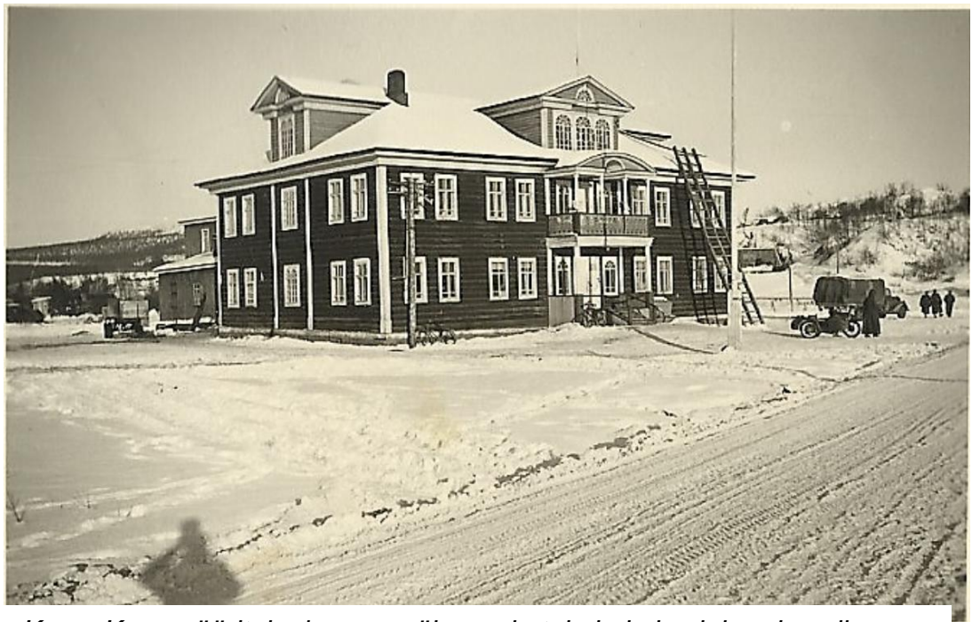
Kuva: Kuvernööritalo, jossa myöhemmin toimi nimismiehen kanslia