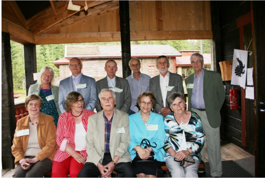
Ylä-Siekkilä ja Syrjälä