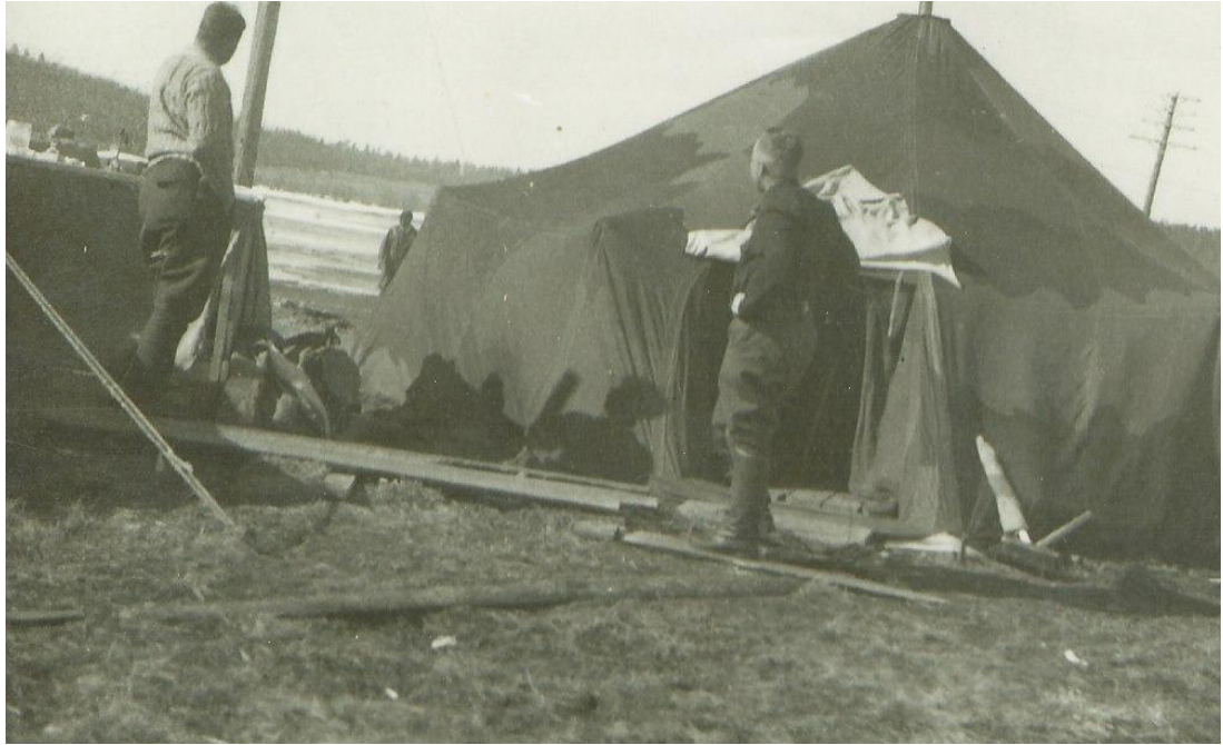
Kuva: Puolijoukkueteltoa, joka toimi alussa nimismiehen kansliana sekä poliisien ja Kuukkasten asuntona. Heidän kotinsa hävitettiin pari-kolme kertaa, jolloin teltta toimi myöhemminkin välillä majoitustilana.